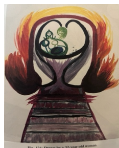
(Billede 2: Theodore Abt, "Introduction to picture interpretation" s. 145)

Snehvide er 7 år da hun tvinges væk fra slottet, hun skal over de 7 bjerge og ud i skoven, hvor hun kommer til at bo hos de 7 små dværge. 7 tallet er gennemgående i eventyret, hvilket kunne pege imod, at vi har at gøre med et kvindeligt individuationseventyr, hvilket jeg kommer ind på senere.