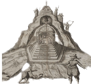
(billed 1 fra artandobject.com)

Jung bruger begrebet individuation om den psykiske udviklingsproces, der gør mennesket til det bestemte enkeltvæsen det nu engang er. Individuationsprocessen sættes ofte i gang af kriser, tab, sår og smerter i psyken.